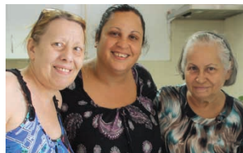
Några av de som lagar den.