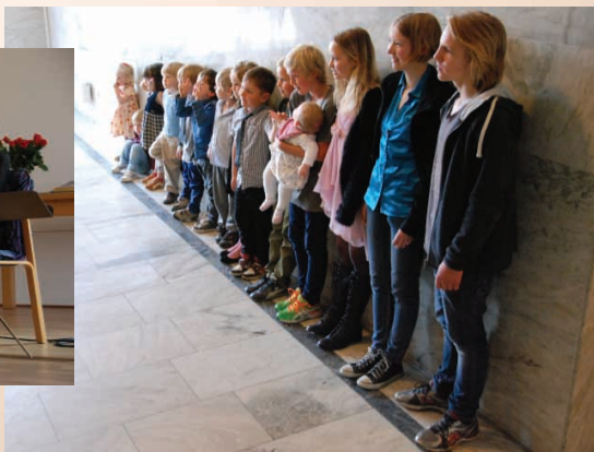
Barnbarn och syskonbarnbarn från 200 års firandet.

Du såg väl videon: Så blev mitt liv www.maj-lis.org