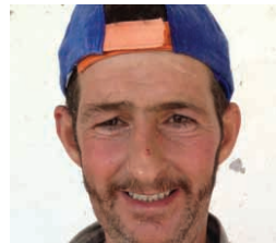
Tacksam få tänder

Andra som fått allt, bedövar sig med droger och behöver befrielse. Andra behöver både kläder och kanske tänder innan de vågar gå ut på jobbintervju. Och oskyldiga små barn behöver insikt att möta livet på ett annat sätt än de vuxna runt omkring dem. Din gåva gör det möjligt att ge en hjälpende hand. Tron och hoppet hjälper människor och samhället att klara både överflöd och brist.