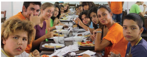
Maten smakar underbart på läger.