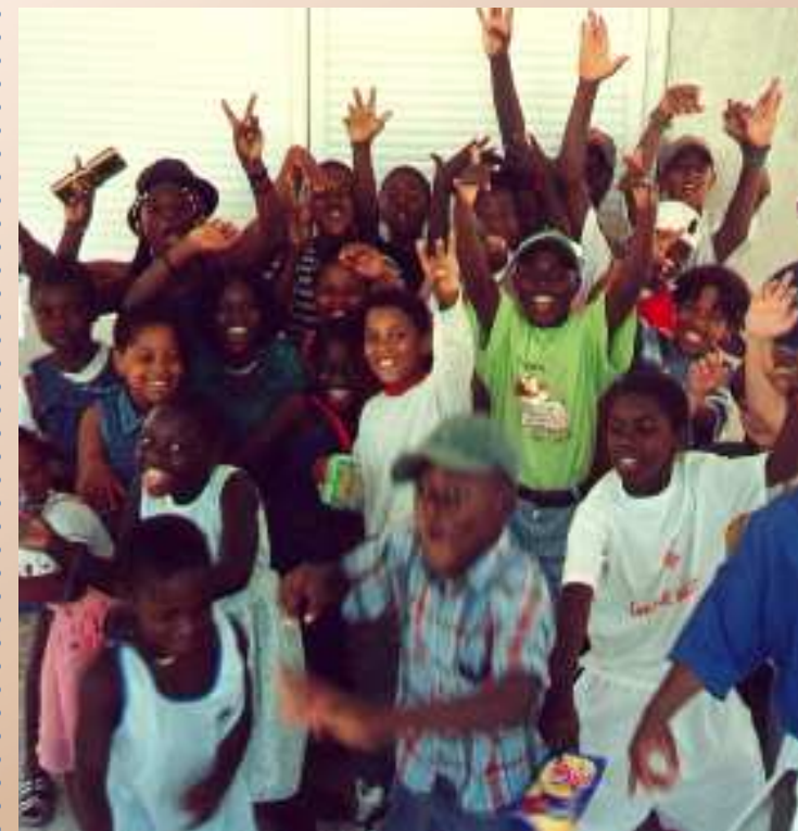
En av grupperna barn som fick åka på sommarläger i år