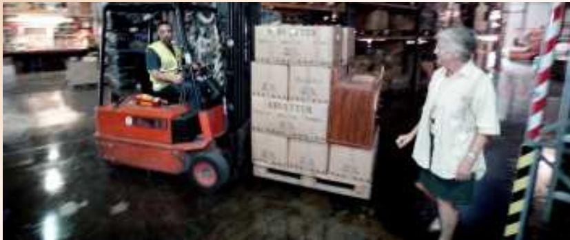
Maj-Lis i Vårgårda där gåvor som skall skickas till Portugal lagras.

Som ung ville hon bli modeskapare och erövra världen med vackra kreationer. I stället blev hon missionär med uppdrag att ge Lissabons fattiga kläder på kroppen.