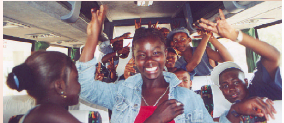
Upprymda och glada barnen som är på väg till de efterlängtdade sommar-lägren