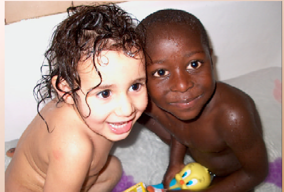
Barn från slummen får hjälp hos familjer som ställer upp.