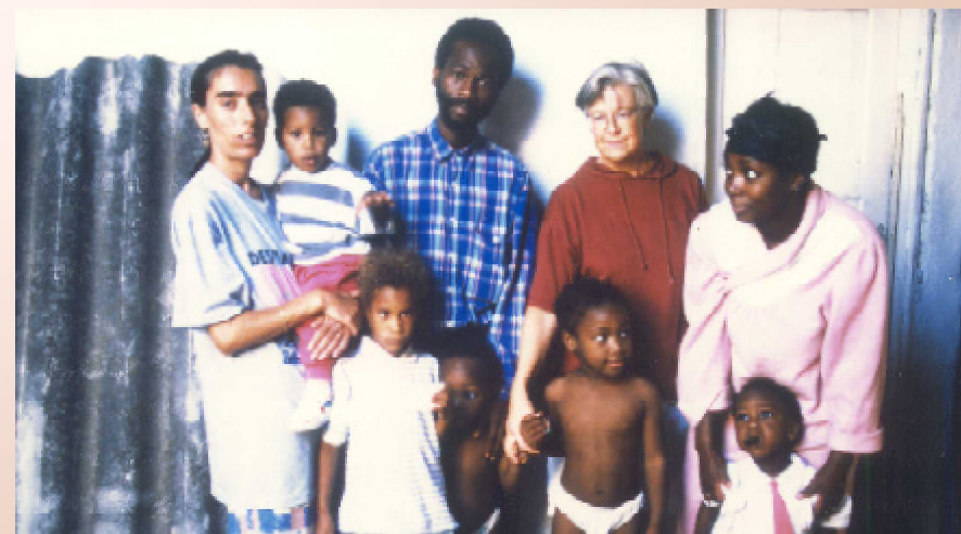
Problemen i världen kvarstår. Detta är en bild från 199?. Den kunde lika gärna ha tagits idag.

Herre, när såg vi dig hungrig och gav dig mat, eller törstig och gav dig att dricka? När såg vi dig hemlös och tog hand om dig eller naken och gav dig kläder? Och när såg vi dig sjuk eller i fängelse och besökte dig? Kungen ska svara dem: “Sannerligen, vad ni har gjort för någon av dessa minsta som är mina bröder, det har ni gjort för mig.” (Matt 25:37-40)