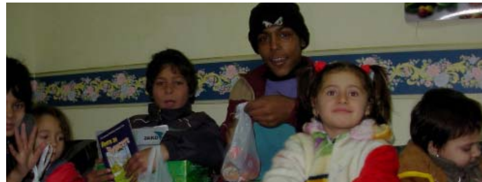
Nya flyktingar med barn kommer till Portugal från alla håll.

Folk som jag möter i Sverige, säger att de trodde att fattigdomen var över i Portugal, men förvånas, då de får höra att Portugal fortfarande är ett av Europeiska Unionens fattigaste länder. Varje dag hjälper vi flyktingar som kommer i kläm mellan byråkrati och skrupelfria arbetsgivare.